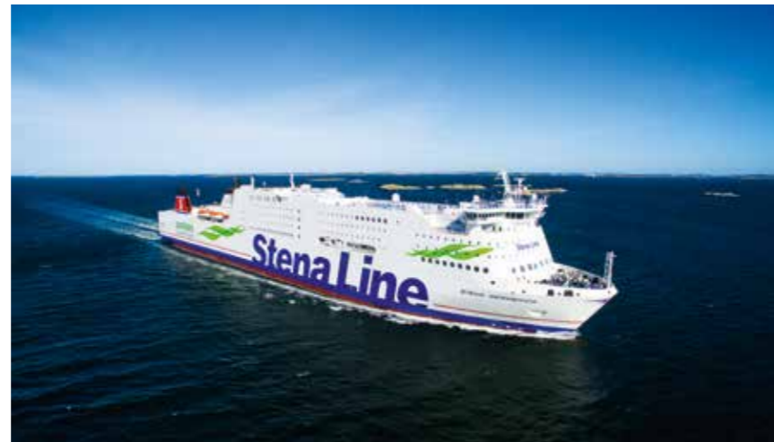
Ombyggnaden av Stena Germanica till metanoldrift har sänkt utsläppen drastiskt.