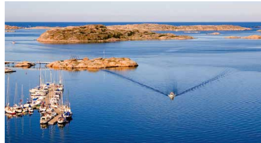
Bovallstrand. Maritim turism är ett av de viktigaste maritima utvecklingsområdena.

Engagemanget har lett till att de samverkande parterna har utökats från VGR, GU och Chalmers till att även omfatta Sveriges Tekniska Forskningsinstitut (SP) samt SSPA Sweden AB (marintekniskt institut/konsultbolag som ägs av Chalmers stiftelse). Havs- och vattenmyndigheten deltar också arbetet med att stärka klustret, liksom Länsstyrelsen i Västra Götaland. Fler parter kan tillkomma som "huvudmän" för maritima klustersatsningen. En första utvärdering ska göras när de prioriterade områdena varit föremål för dessa kraftsamlingar för innovation under två år, dvs. under 2015-2016.