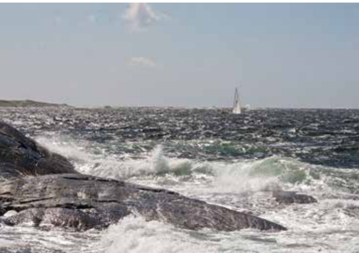
Långsiktig förvaltning av havet är en förutsättning för hållbar maritim utveckling.