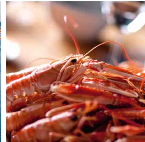
Havskräftor är ett av Bohuslänns marina livsmedel i absolut toppkvalitet.