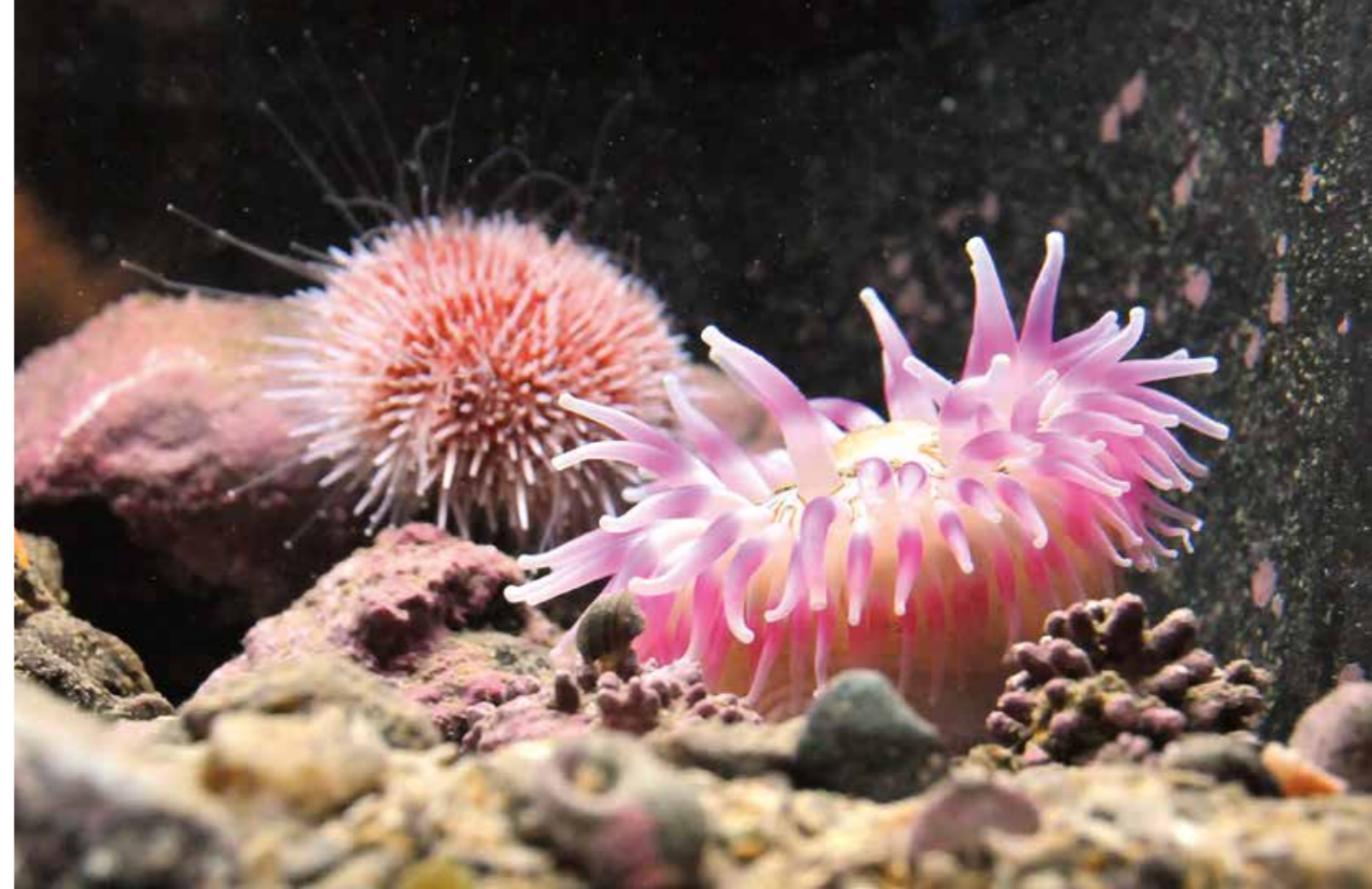
Marin bioteknik är ett prioriterat område inom Västra Götalands satsning på maritima klustret.

Den maritima sektorn med sin mångfald av branscher och enskilda kvalificerade verksamheter är ett av Västra Götalands styrkeområden. Havsanknuten verksamhet pekas ut som ett styrkeområde i tillväxt- och utvecklingsstrategin Västra Götaland 2020 och ingår också i begreppet ”Five Clusters” som representerar gemensamma styrkeområden för VGR, Göteborgs stad, GU, Chalmers och Västsvenska Handelskammaren. Övriga områden är fordonssektorn, grön kemi, life science och hållbar stadsutveckling. Den maritima sektorn består som tidigare nämnts av flera olika verksamheter med olika grad av kopplingar sinsemellan. Men det finns också kopplingar mellan styrkeområden i ”Five Clusters” som till exempel mellan fordonssektorn och sjöfarten samt mellan grön kemi och marina biomaterial. Samverkan är ett ledord för näringslivsutveckling i Västra Götaland och det innebär såväl integration mellan branscher som samverkan mellan företag, universitet och institut samt offentliga aktörer.